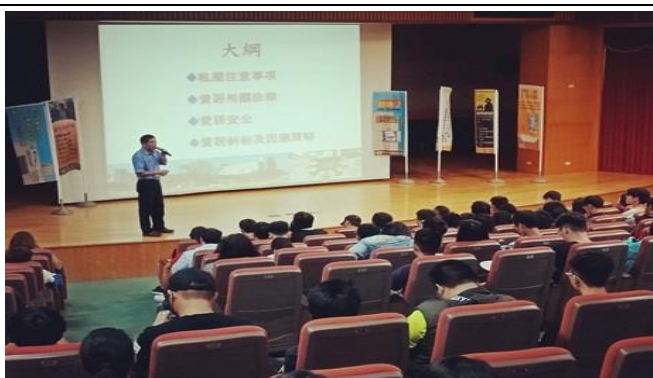
圖片說明：講師上課情形