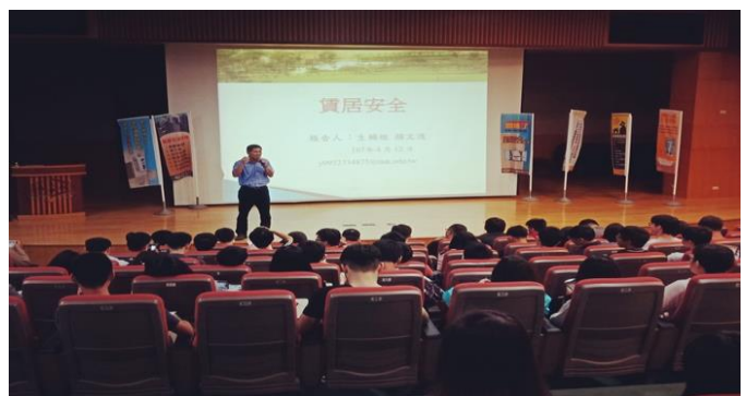
圖片說明：講師上課情形