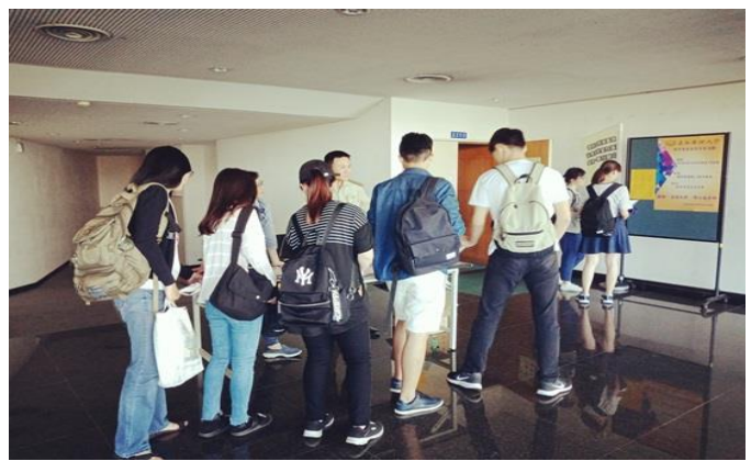
圖片說明：同學陸續進場