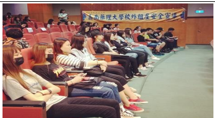
圖片說明：同學認真聽課