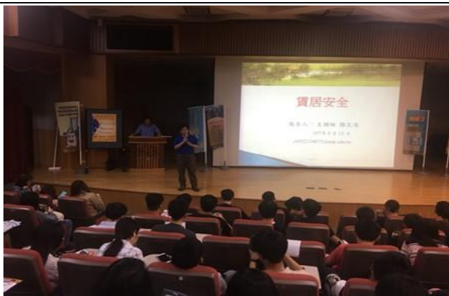
圖片說明：承辦人介紹講師